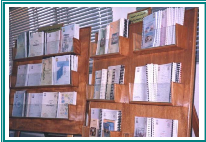
الإصدارات الدورية والغير دورية