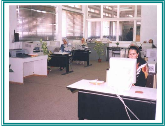
إدارة الحاسب الآلى